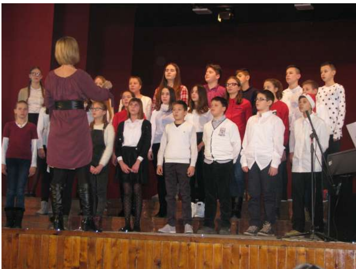
Дана 28.12.2017. године извршена је подела ђачких књижица.