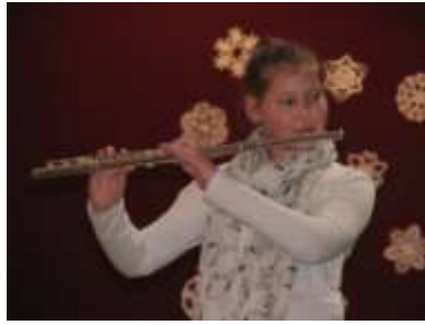
2.НАЂПАЛ ЖОФИА, класа Пинтер Оливер – флаута - II место